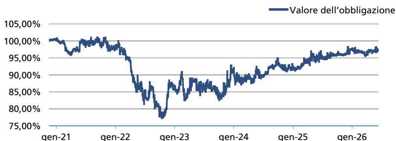
GRAFICO ANDAMENTO PREZZI OBBLIGAZIONE*

*Fonte Dati grafico: Borsa Italiana, prezzo di chiusura ufficiale